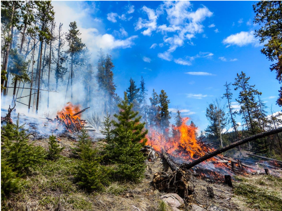
Was bewirkt Feuer im Wald?

Donnerstag, 25. April 2019, Zone industrielle Rondchâtel, Péry